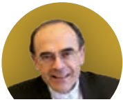
Cardinal Philippe Barbarin Archevêque de Lyon

« POUR UNE ÉGLISE FRATERNELLE ET MISSIONNAIRE »